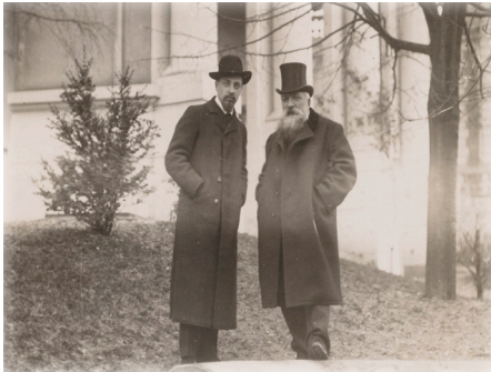
Rainer Maria Rilke (à gauche) était le secrétaire particulier du sculpteur Auguste Rodin.

Une exposition intitulée "Rodin selon Rilke" prendra place à la Fondation Gianadda à Martigny du 26 juin au 22 novembre 2026. Organisée par le musée Rodin de Paris, elle nous permettra de surprendre, à son paroxysme, le point de rencontre de deux regards, parmi les plus acérés du XXème siècle.